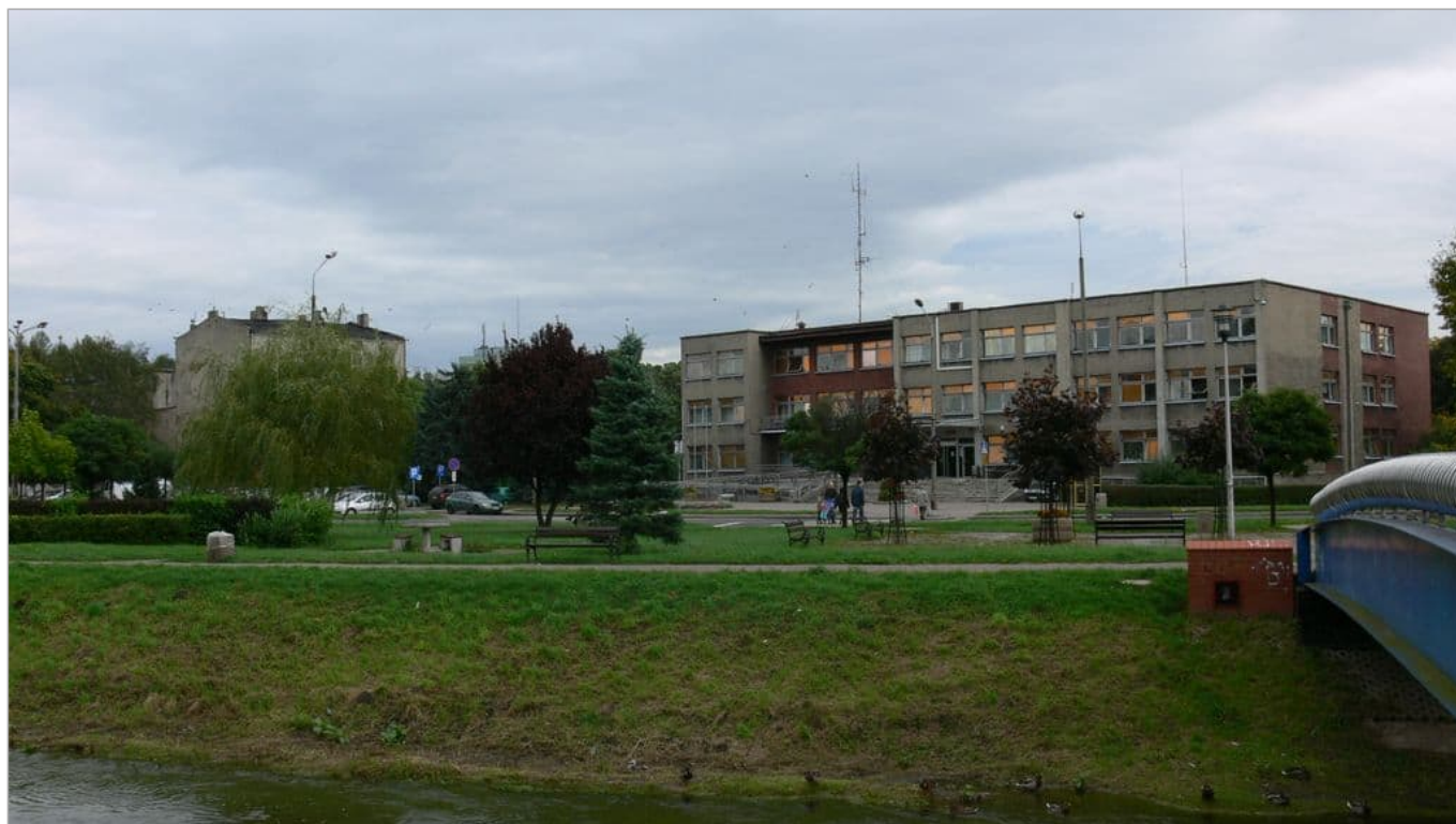
Zdjęcie 4 z 22