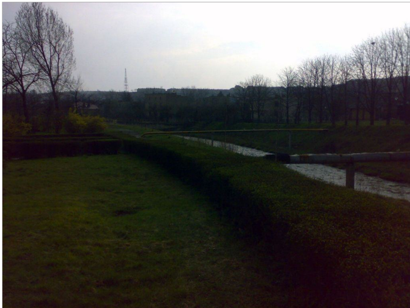
Zdjęcie 1 z 11