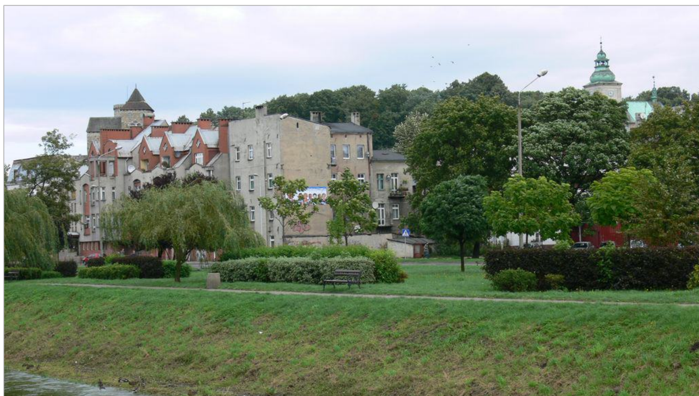
Zdjęcie 3 z 22