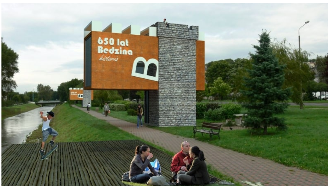
Pawilon historii_UNREAL 12

przychód do kasy miasta. Przecież wzdłuż bulwarów aż prosi się o kilka pawilonów gastronomicznych, herbaciarnię, toaletę publiczną, może i jakieś moło drewniane, scenę artystyczną, fontanny które zimą mogłyby służyć jako mini lodowiska czy choćby kilka całosezonowych placów zabaw. Wszystko to można by połączyć z kioskami promującymi miasto, takimi jakie są obecne już dziś wszędzie w Europie Zachodniej. Może udałoby się przenieść festiwal celtycki wzdłuż rzeki i połączyć go z kupieckim jarmarkiem. Morze życzeń... ale na dzień dzisiejszy nad rzekę nie ma niestety po co przychodzić. Władze miasta muszą zdawać sobie sprawę, że przywracanie miastu rzeki to długotrwały proces wymagający konsekwentnego prawa i wizji, ale zagospodarowanie w prosty i sensowny sposób bulwarów nadrzecznych ma szansę znacznie przyspieszyć ten długotrwały proces. Poniżej zamieszczam mój luźny pomysł na pawilon promujący Będzin, który mógłby się stać jednym z elementów wypełniających monotonną przestrzeń nadrzeczną.