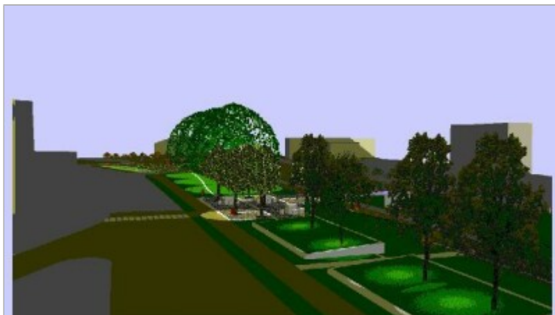
Zdjęcie 1 z 5