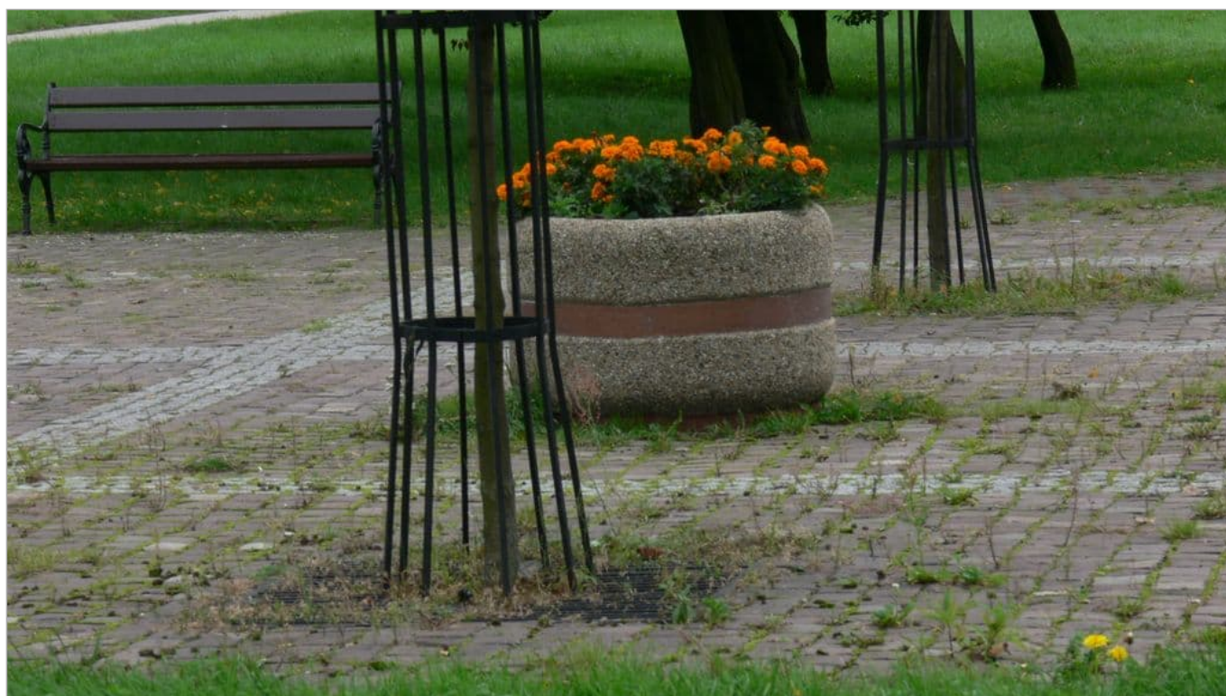
Zdjęcie 22 z 22