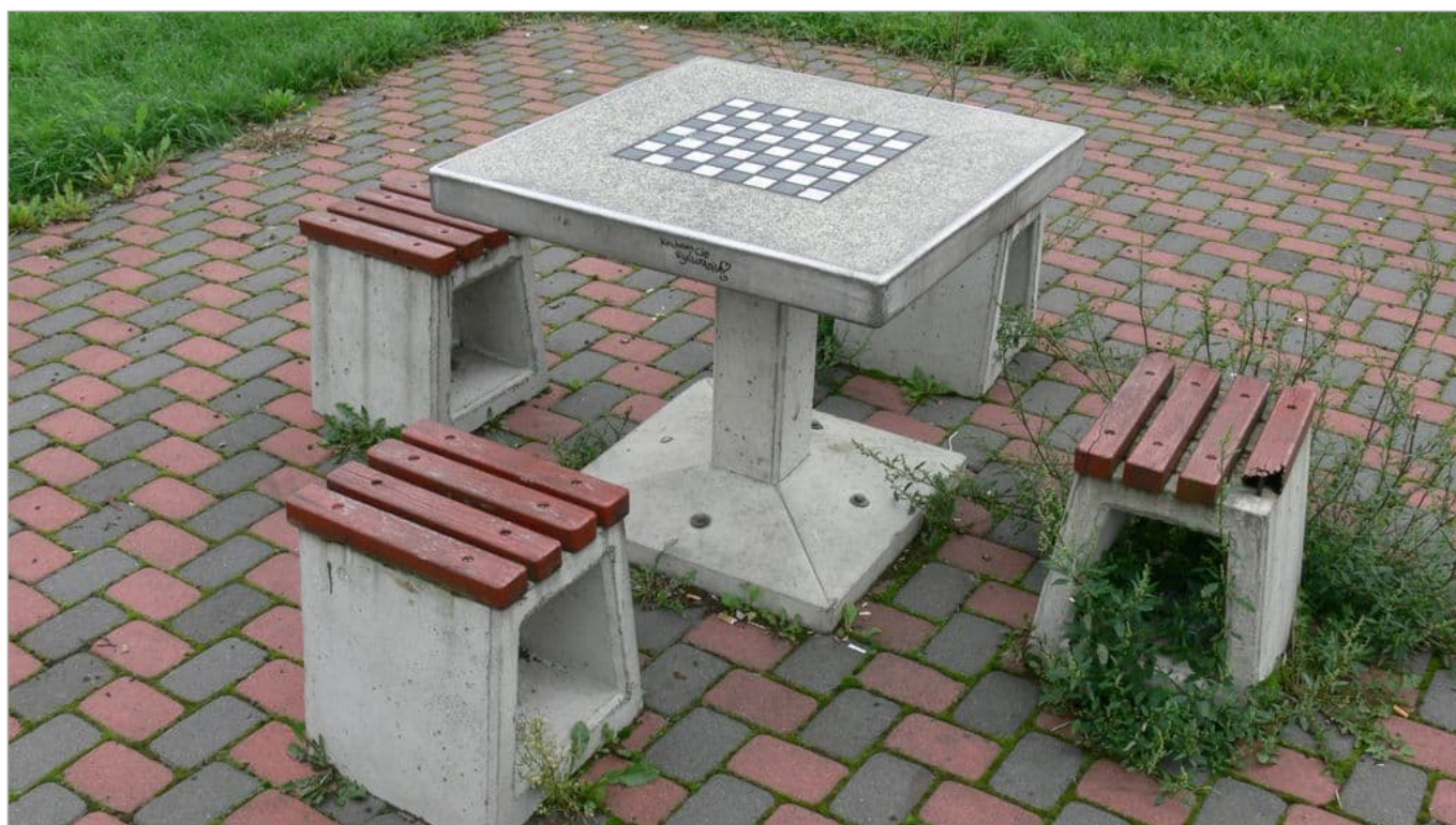
Zdjęcie 21 z 22