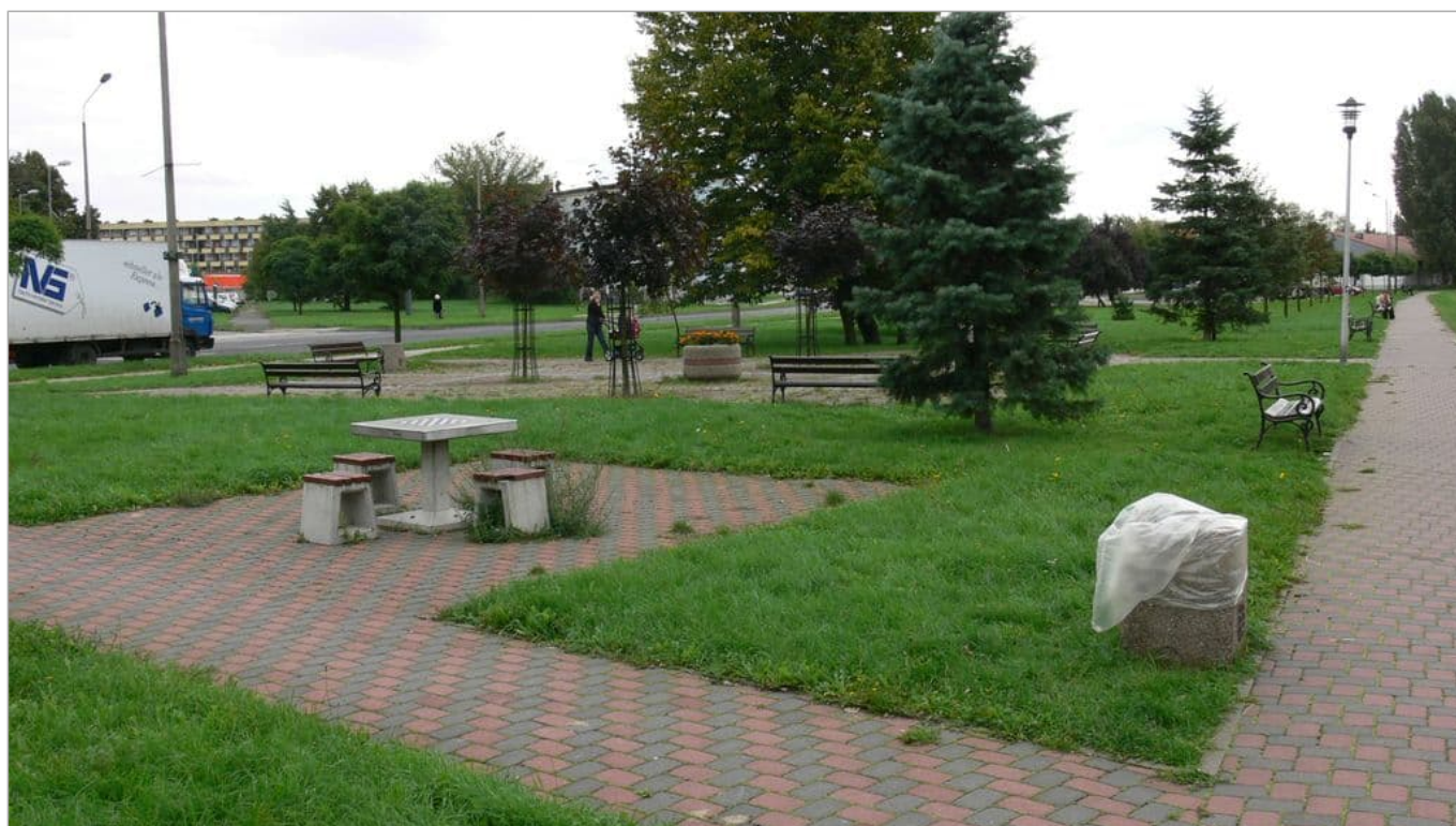
Zdjęcie 20 z 22