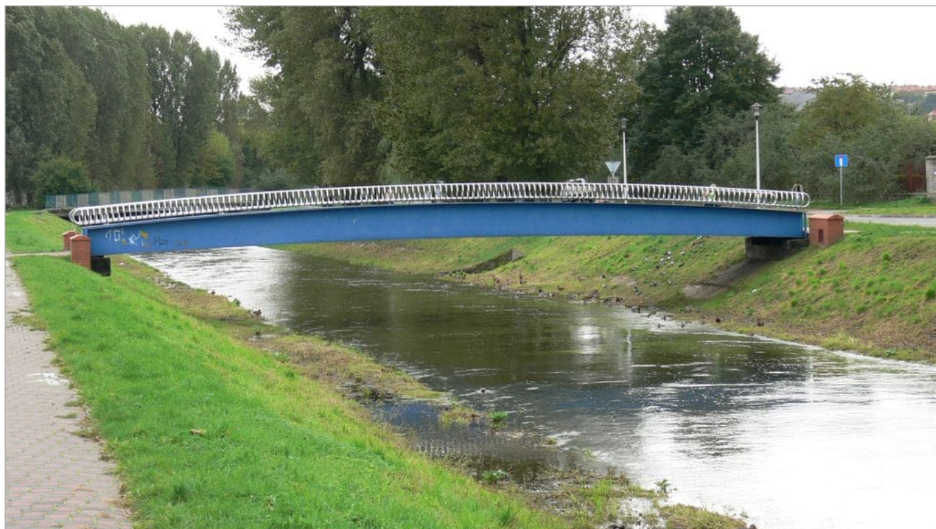
Zdjęcie 19 z 22