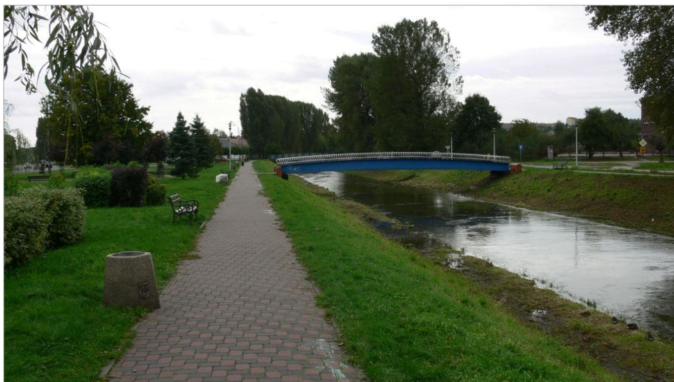
Zdjęcie 18 z 22