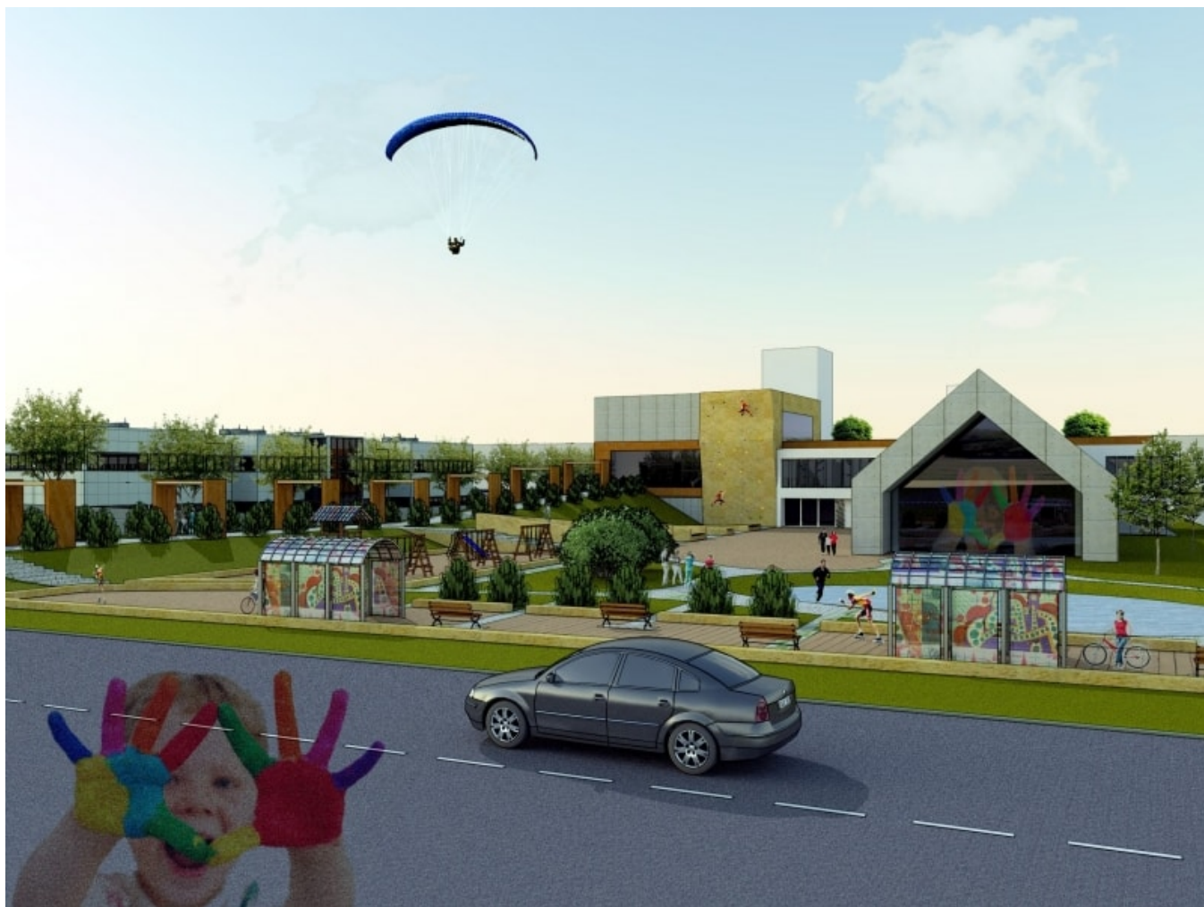
>Centrum rekreacyjno-sportowe "AKTYWNI SOSNOWIEC"