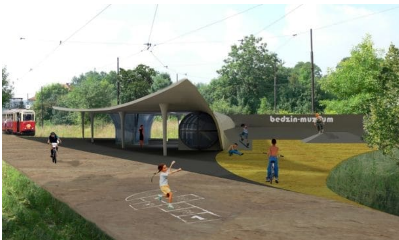
>Reutilizacja linii 25