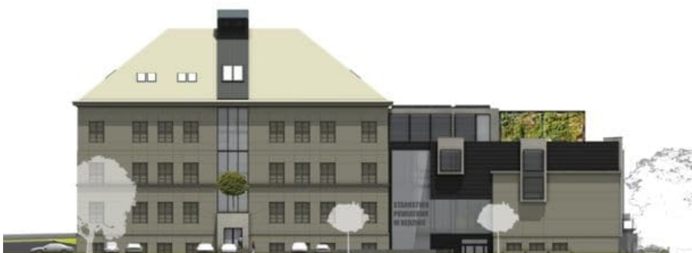
>Projekt nowej siedziby Starostwa Powiatowego w Będzinie