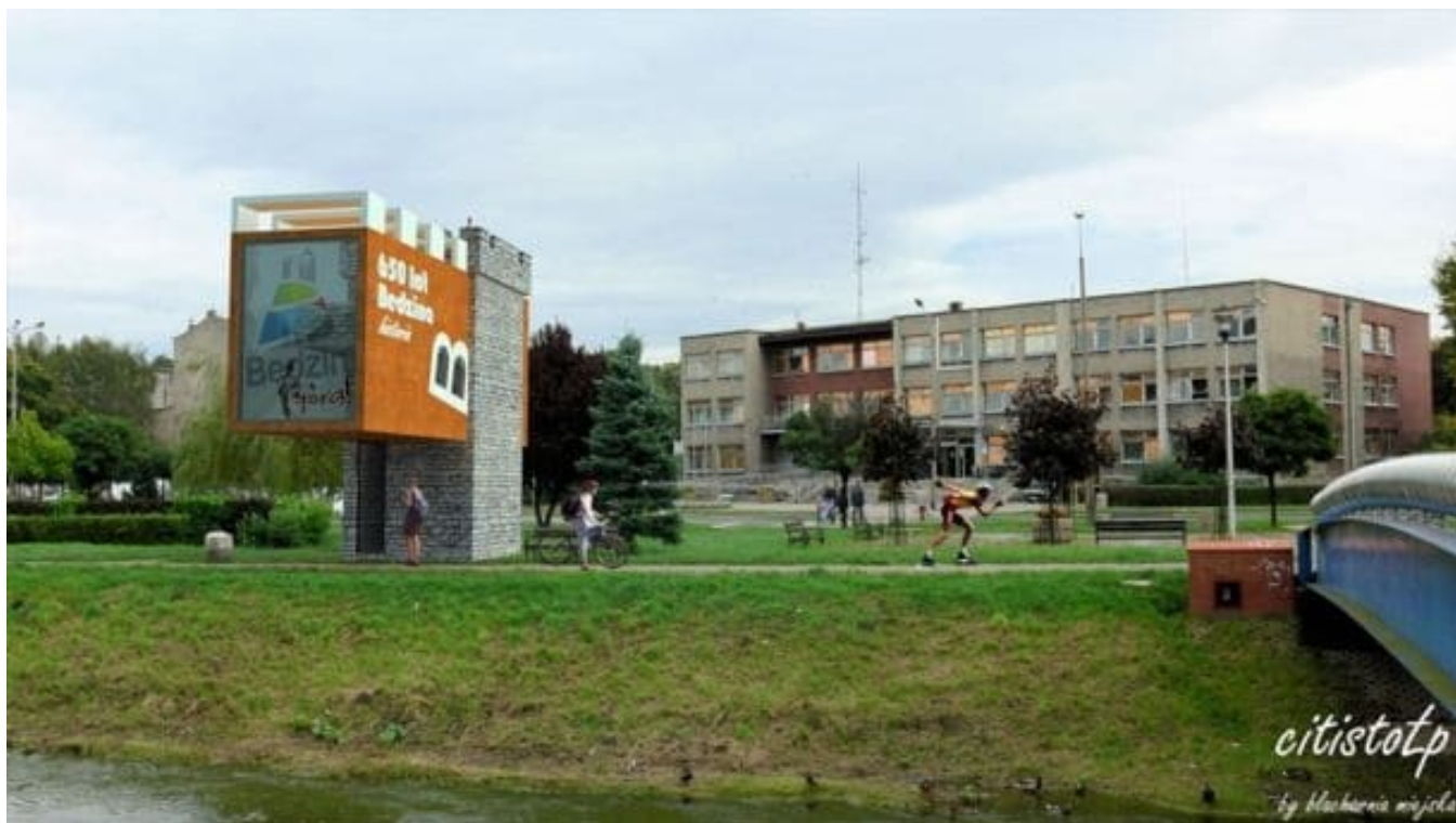
>Punkt widokowy w mieście