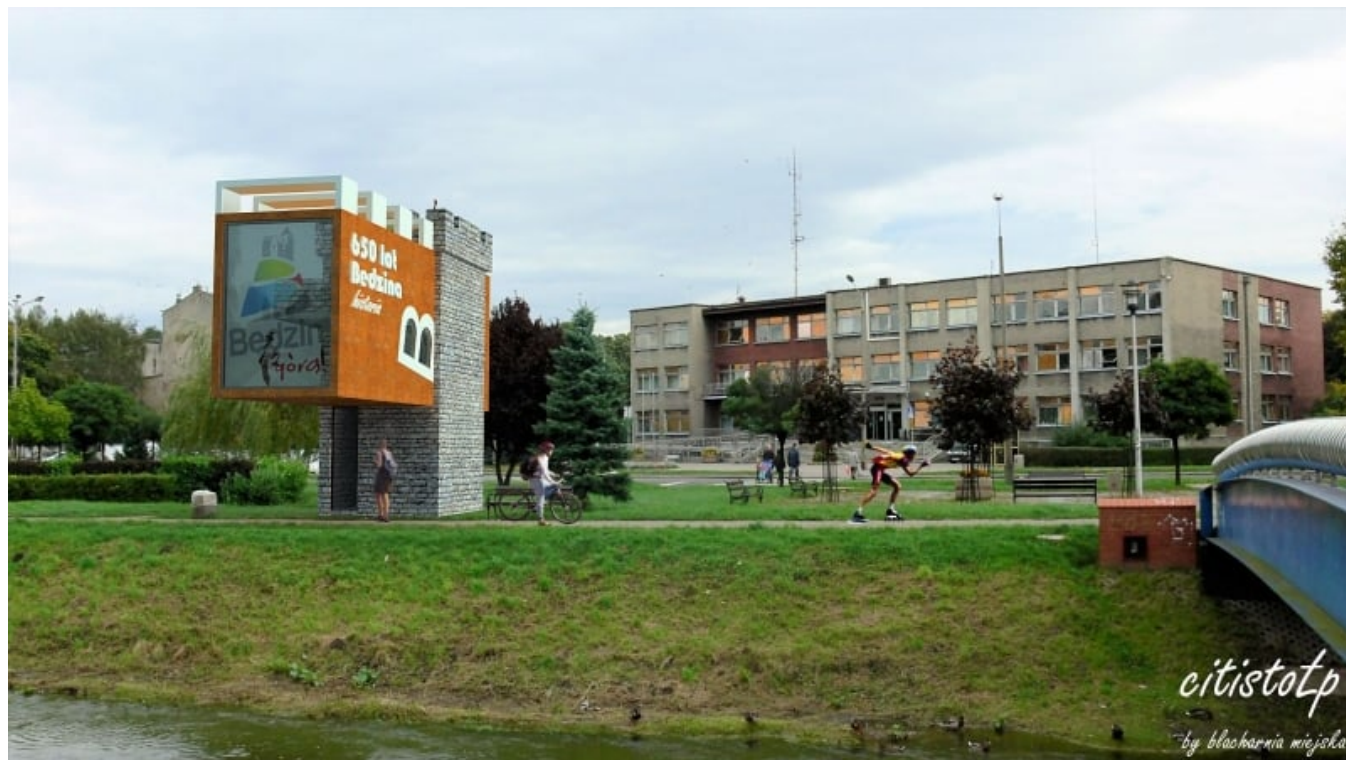
Punkt widokowy Czarna Przemsza

Ze względu na to, iż w Będzinie coś ostatnio drgnęło w ogólnym wizerunku miasta, postanowiłem dorzucić własną cegiełkę w postaci pomysłu, który mógłby w jakiś sposób wspomóc promocję naszego szarego Będzina.