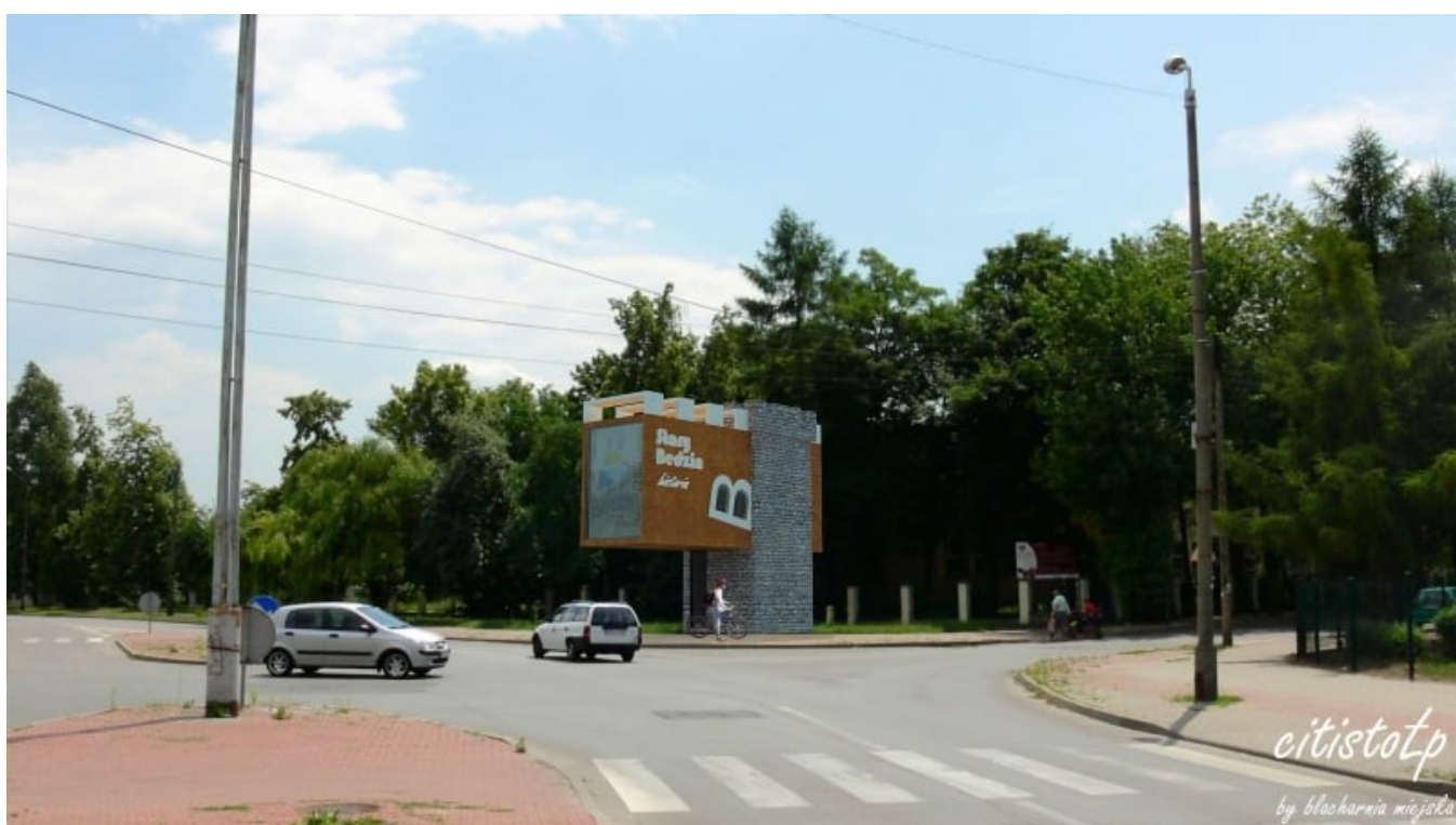
Punkt widokowy przy Krasickiego wyświetleń: 643