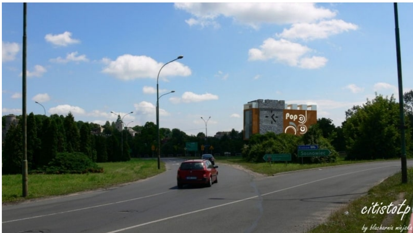
Punkt widokowy Rondo