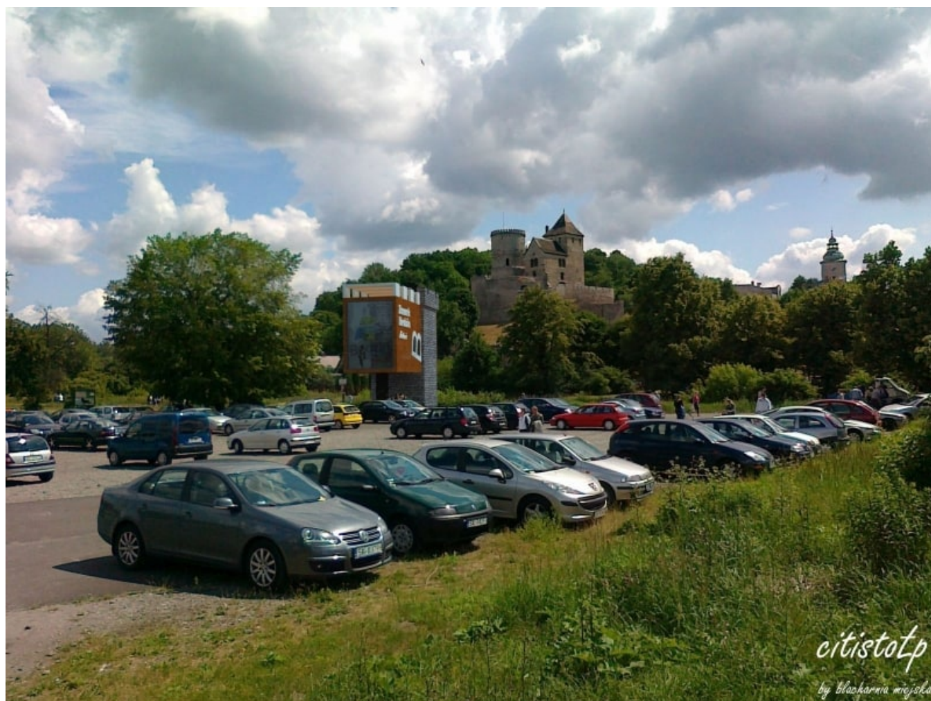
Punkt widokowy Zamek

CitistoŁp czyli punkt widokowy w mieście to projekt, który ma na celu pokazanie różnych aspektów widzenia Będzina. Sposobem na to jest sieć punktów widokowych o powtarzalnej formie w kształcie stołpów czy jak kto woli baszt miejskich, umieszczonych na różnych poziomach i wysokościach w naszym mieście. Miejski punkt widokowy to próba odtworzenia miejsca, z którego podpatrujemy miasto w innym wymiarze, który jest scaleniem dwóch światów: architektury człowieka i średniowiecznego miasta. Jego zadaniem jest pomóc unieść się człowiekowi ponad tłumem i zobaczyć miasto z innej perspektywy. Przebywając w punkcie zmienia się jakość naszego widzenia i uruchamiane są nowe zmysły postrzegania. Miejsce, gdzie zaaranżowany jest punkt widokowy nie jest przypadkowe (w obrębie naszego miasta można spokojnie wskazać kilkanaście miejsc godnych uwagi). To miejsca ważne w urbanistycznej tkance Będzina, zbudowane na historii ów miejsca.